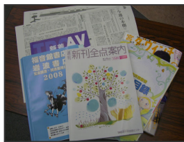
様々な出版情報を参考にし

各館で協議した内容は、週に1度開かれる選書会議に持ち寄り、最終調整します。各館の担当者が参加するこの会議では、複数館での購入が必要か、購入館は妥当か、購入の必要があるかなどを協議します。リクエストがあった図書についても同様に検討します。