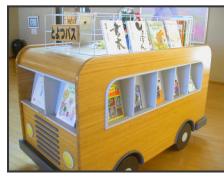
新着本のコーナー

みなさんは、図書館に入ったらずいどこをチェックしますか？どんな本が読まれているか気になる人におすすめは「今日返ってきた本」のコーナー。何か面白そうな本はないかと探している人には、テーマを設定して本を展示している「特設」コーナーはいかがでしょう。そし