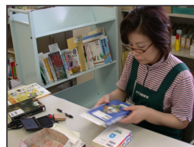
1冊ずつ丁寧に確認します。

ています。このとき本の書誌データも一緒に納品されます。書誌データとは書名、著者名をはじめ、本の大きさから内容に至るまでそれぞれの本に関する情報をコンピュータで管理するためのデータです。 みやこ町は本の装備、データ作成を外部に委託しています。本が届いたら、装備は適当か、データ修正の必要はないかなど1冊ずつ職員の手で確認します。