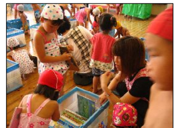
久保保育所での様子