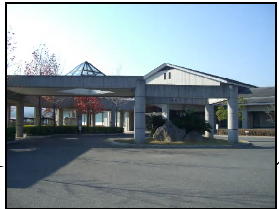
みやこ町犀川図書館