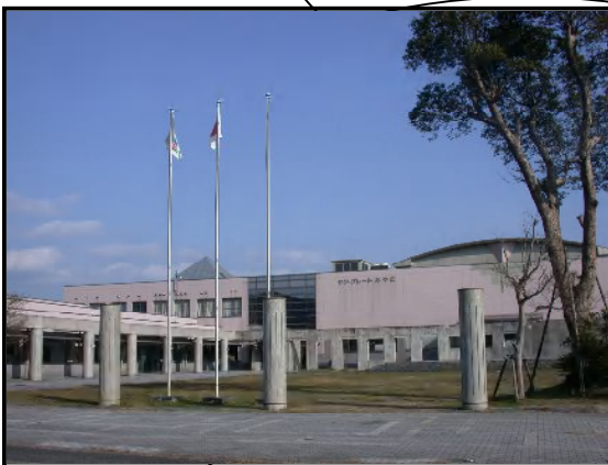
みやこ町勝山図書館