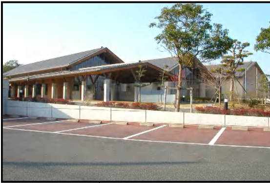
みやこ町中央図書館