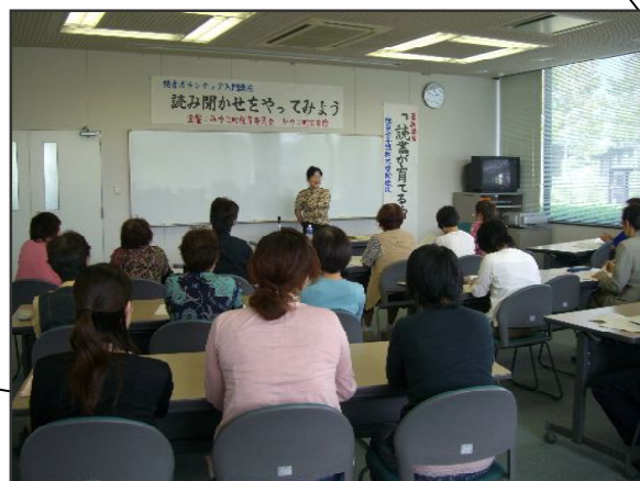
読書ボランティア養成講座