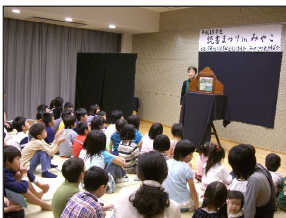
読書まつり in みやこ